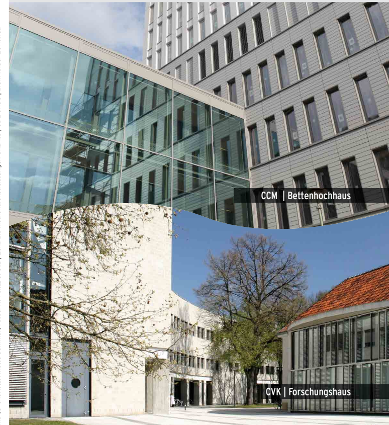
CCM | Bettenhochhaus